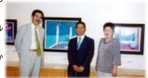
親戚軍団・・・毎年結集！