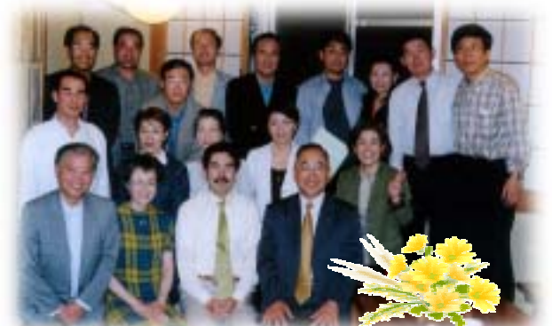
「ボンジュール修太・博多」の皆さんと、東京地区ファンクラブメンバーとの交流会！♪はヤッパリ「博多・祝い唄」一本締め！