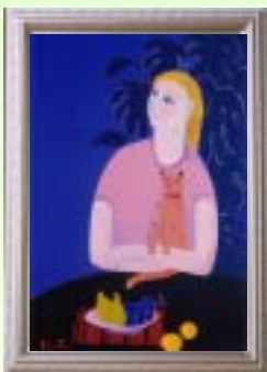
DM 作品 「くつろぎの時」 12号 M

『今を生きる女性達』を描きたい・・・！ 数年前から修太作品に登場し始めた人物像が、より確かに表現された一点。女性の美しさと、豊かさを、絶妙の色彩と構図の中、 『目』の表情にも、その意思が・・・ 伝わってくるかの様だ・・・。