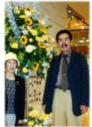
郷土の星 (佐賀県出身)